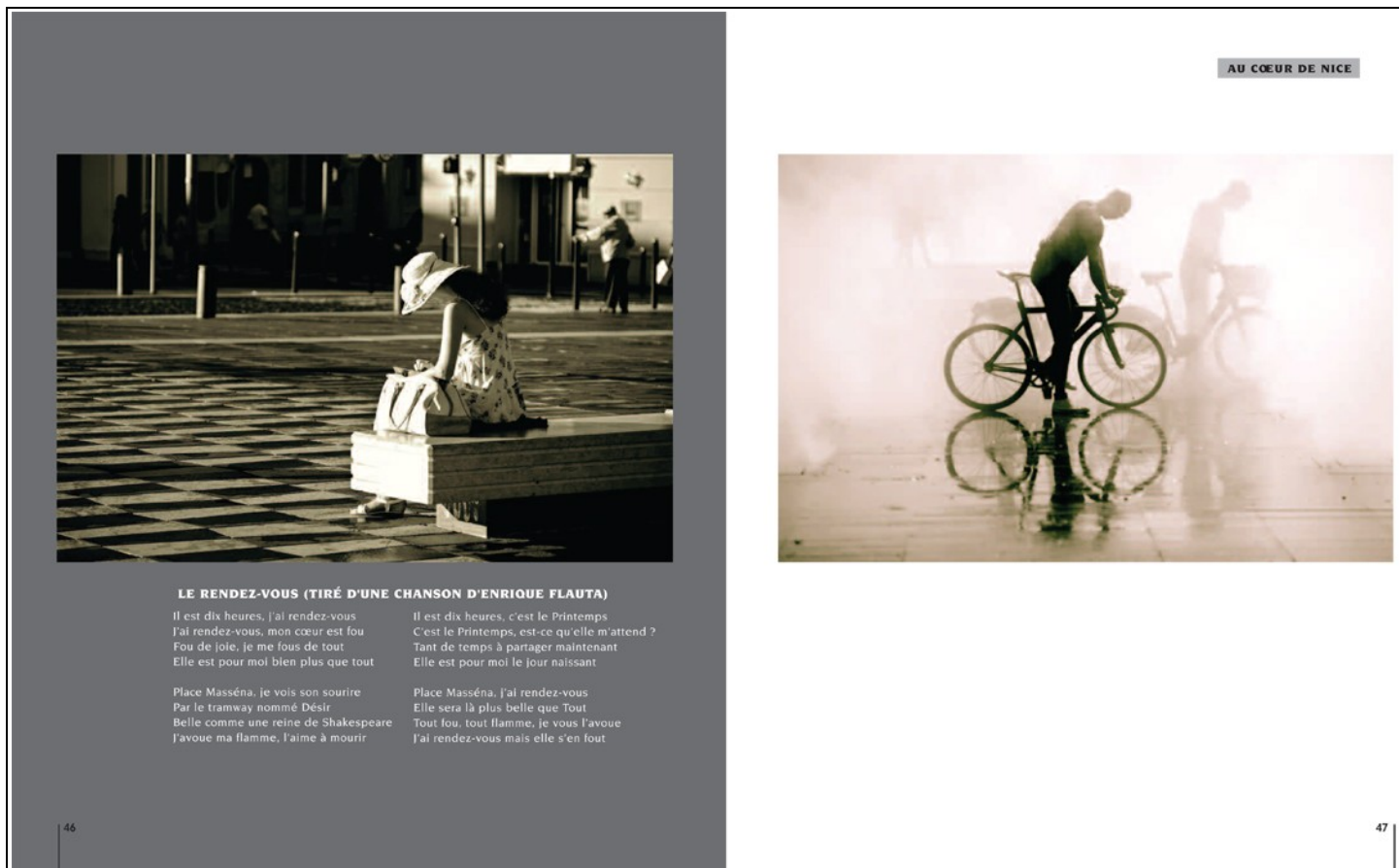
Une Prom' fragile et mélancolique ou une place Masséna au petit jour, à chacun ses moments intimes.